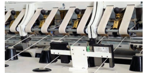
OTOMATİK FİTİL GERGINLIK KONTROLÜ