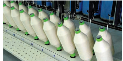
MASURA DEVİRME MEKANİZMASI